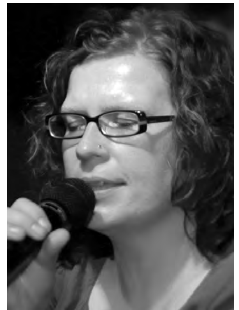
Dani legte sich gesanglich ins Zeug

Die Anfragen häufen sich im Moment, so dass wir hier jetzt mehr damit auf Tour gehen und das Programm weiter ausbauen werden.