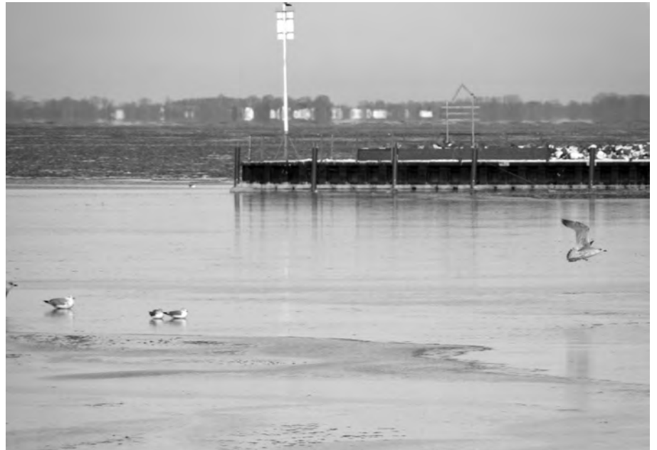
Winteridylle am Mönkebuder Haffen