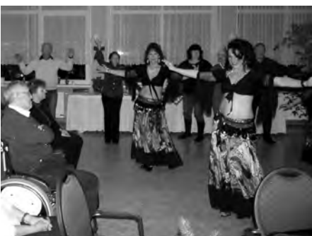
Nach orientalischer Musik haben die „Zuckerpuppen“ zum mittanzen aufgefordert.

Wir sagen allen Beteiligten unseren Dank für die gelungene Weihnachtsfeier.