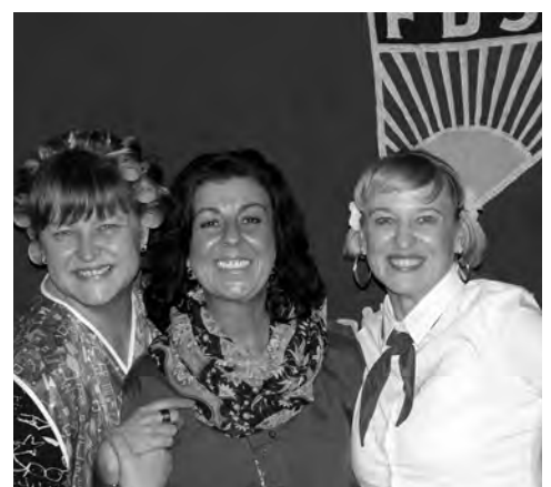
Sichtlich Spaß hatten die Gäste