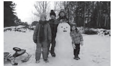
Rodelspaß in Meiersberg

Die Kameraden der Freiwilligen Feuerwehr Ferdinandshof Löschgruppe Meiersberg