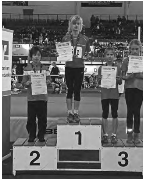
Die beiden Mädchen bei einer Siegerehrung